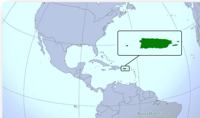
Figura 1: Localización relativa de Puerto Rico. Disponible en:

Puerto Rico, la tierra de la salsa, del reggaetón, de la bomba y la plena (estos dos últimos son bailes de origen africano), paraíso terrenal bañado por las cálidas aguas del Mar Caribe por el sur y el Océano Atlántico por el norte; es la más pequeña de las denominadas Antillas Mayores. 20 Sus principales coordenadas geográficas son 18° 15" Latitud Norte y 66° 30" Longitud Oeste. “Se localiza a unos 2.594 km al sudeste de Nueva York, a 1.673 km al sudeste de Miami y a 128 km al este de República Dominicana. Distan 804 km de Venezuela en América del Sur y 6.638 km de la Península Ibérica, en Europa”. (Alicea, 2002: 18).