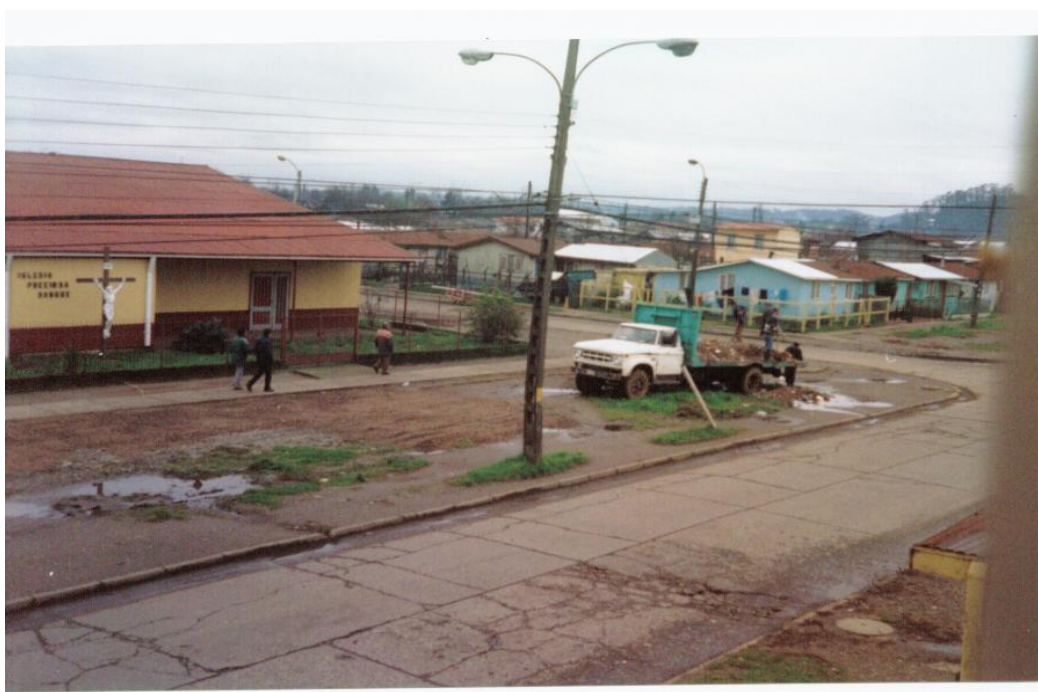
(Vista del Templo de la Parroquia Preciosa Sangre por calle Dr. Holzapfel. Atrás, la Población Clemente Holzapfel. Años ochenta.)