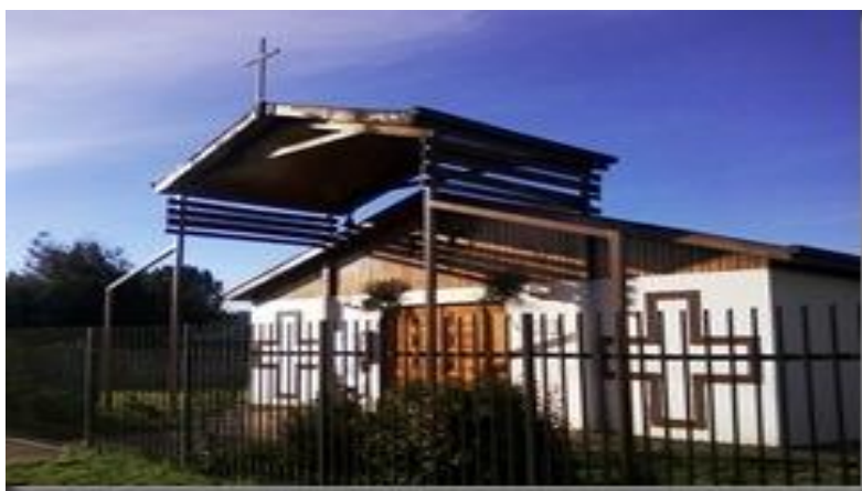
(Vista actual de Capilla Santísima Trinidad en la Población Independencia, Valdivia. Fuente: Congregación de los Padres de la Preciosa Sangre CPPS)