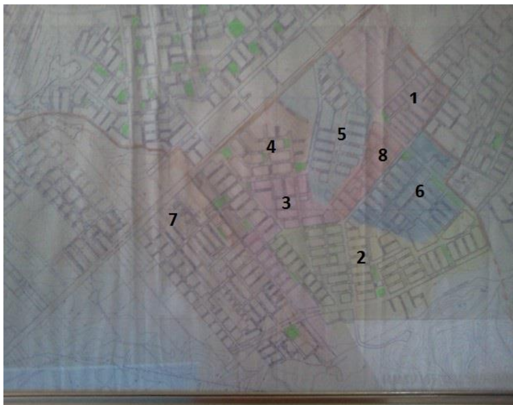
(Plano y simbología de sectores abarcados territorialmente por las CEB de CORVI 95. Detalle de plano perteneciente a la oficina parroquial de Preciosa Sangre de Jesús.)