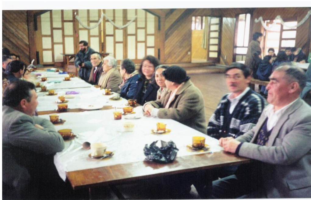
(Encuentro y reunión de comunidades en el salón principal de la Parroquia Preciosa Sangre. Años ochenta.)

En el salón del actual comedor de la parroquia San Pío X no era distinto, se reunían las comunidades junto a los sacerdote una o dos veces por año para analizar temas de formación y proyectos solidarios.