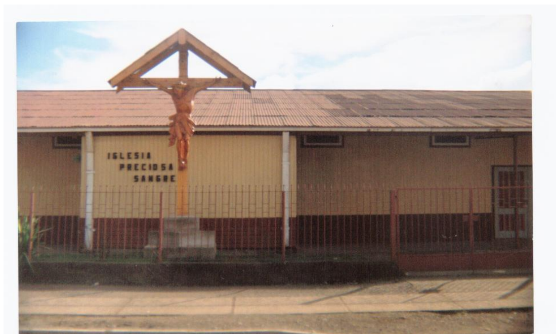
(Fachada de Parroquia Preciosa Sangre. Años noventa.)