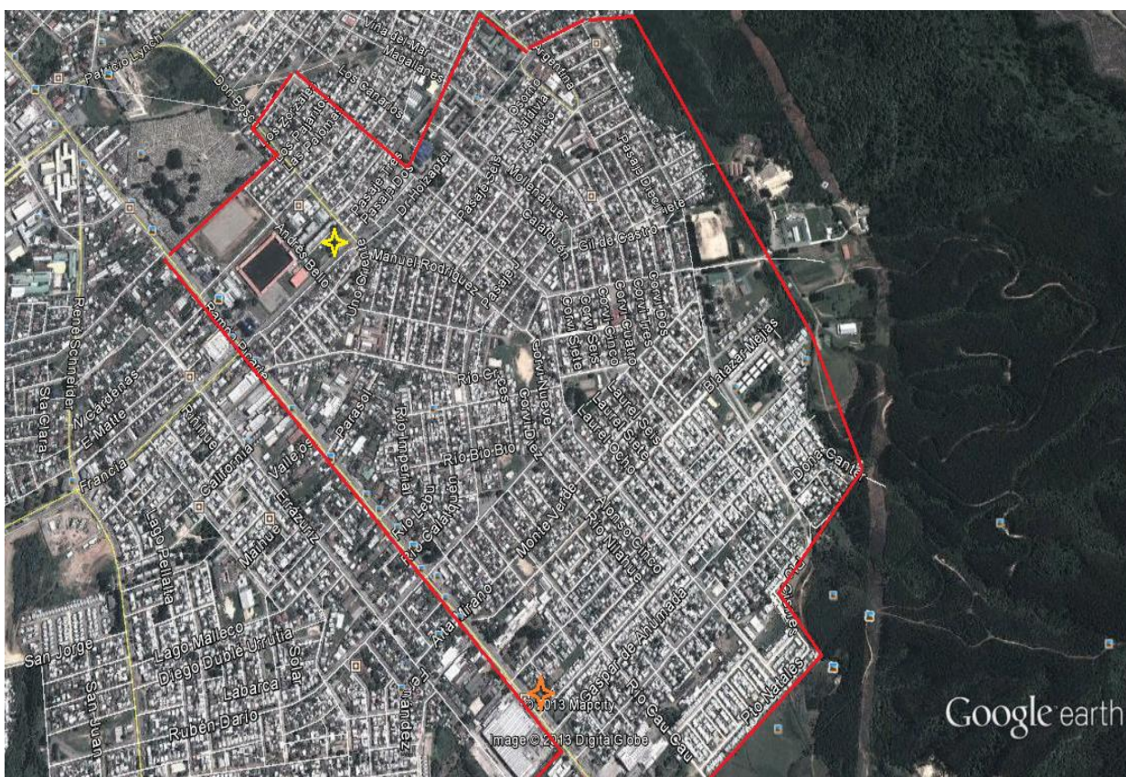
(Vista satelital del sector “CORVI” 80 . Año 2005.)

El sector descrito ha sufrido con el tiempo diversas transformaciones que lo tuvieron en constante crecimiento, recibiendo tres grandes impulsos habitacionales, uno en los años sesenta, durante sus orígenes, con la construcción del proyecto habitacional a cargo de la Corporación para la Vivienda (CORVI) que dio paso a la conformación de la población Gil de Castro en 1960, primer núcleo que daría vida al sector, ello luego de la emergencia de albergar a más de 30.000 refugiados de distintos sectores urbanos y rurales de Valdivia tras el terremoto y maremoto de 1960. Distintas fases de la población Gil de Castro irían agrandando el barrio durante los años sesenta, así como también por la creación de las poblaciones Menzel y Clemente Holzapfel, hasta alcanzar todo el conjunto desde la línea de calle Rubén Darío hacia el poniente, donde se encuentra la Población El Laurel, también construida tras el cataclismo, y que recibiría para su concreción aportes del gobierno norteamericano.