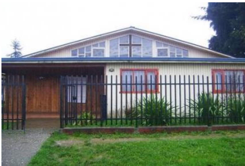
(Fachada actual de Parroquia San Pío X en Inés de Suárez, Valdivia.)

La Iglesia de Valdivia y la misma comunidad de Inés de Suárez y Los Jazmines tuvieron una serie de inconvenientes para establecer un recinto y una capilla para la celebración del culto católico y las actividades de asistencia social que se proponían. Antes del terremoto, el Obispado contaba, originalmente, con un terreno dentro de la población Inés de Suárez que sería ocupado luego del Terremoto de 1960 para la construcción de albergues y viviendas momentáneas y que darían origen a Los Jazmines, recibiendo por permuta el actual terreno que ocupa la parroquia San Pío X, anexando a este una dependencia contigua que pertenecía a un jardín infantil donde empezaría a funcionar prontamente la escuela “San Pío X”, de la cual toma su nombre la posterior parroquia. Esta última, aunque era dirigida por el sacerdote Ganassin, pertenecía a la Fundación de Viviendas y Servicio Social, y desde 1964 pasaría a ser mantenida por las Religiosas de Santa Marta quienes además generaron otra institución en la población Valparaíso, llamada “Rafael Lira”, la que más tarde, cambiaría su nombre a “Santa Marta”. La importancia del establecimiento de estas escuelas y de su conducción por parte del clero en el sector radicaría en el hecho de ser plataformas para que los misioneros y religiosos puedan involucrarse con el sector de manera más directa y comprometida.