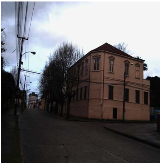
Casa Luis Oyarzún. Dirección de Extensión, UACH.