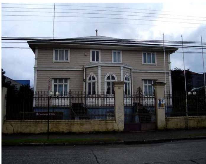
Conservatorio de Música, UACH.