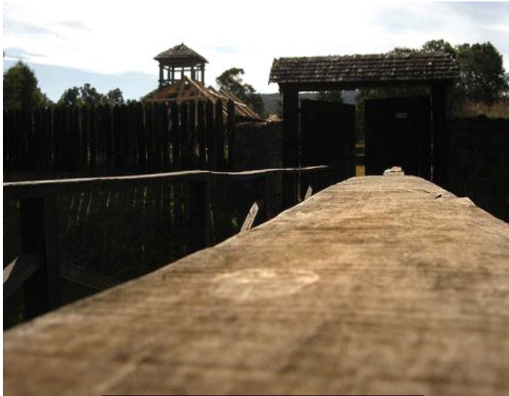
Castillo San Luis de Alba de Cruces, UACH.

Años más tarde, una inundación destruyó el fuerte obligando a los españoles a construir otro en un lugar llamado “Cruces” a orillas del río Mariquina. Posteriormente, cuando el Virrey del Perú,