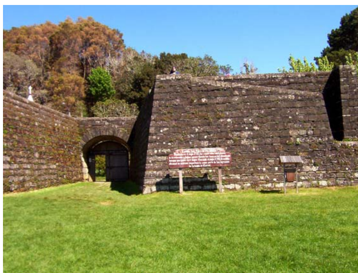
Museo de Sitio Castillo San Pedro de Alcántara, Isla de Mancera.

El Castillo San Pedro de Alcántara fue construido en la estratégica Isla de Mancera en 1645, luego de la refundación de Valdivia por orden del Marqués de Mancera y Virrey del Perú, Don Antonio Sebastián de Toledo.