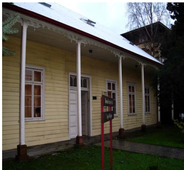
Hogar estudiantil universitario.