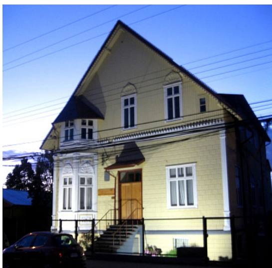
CEC. Centro de Educación Continua, UACH.