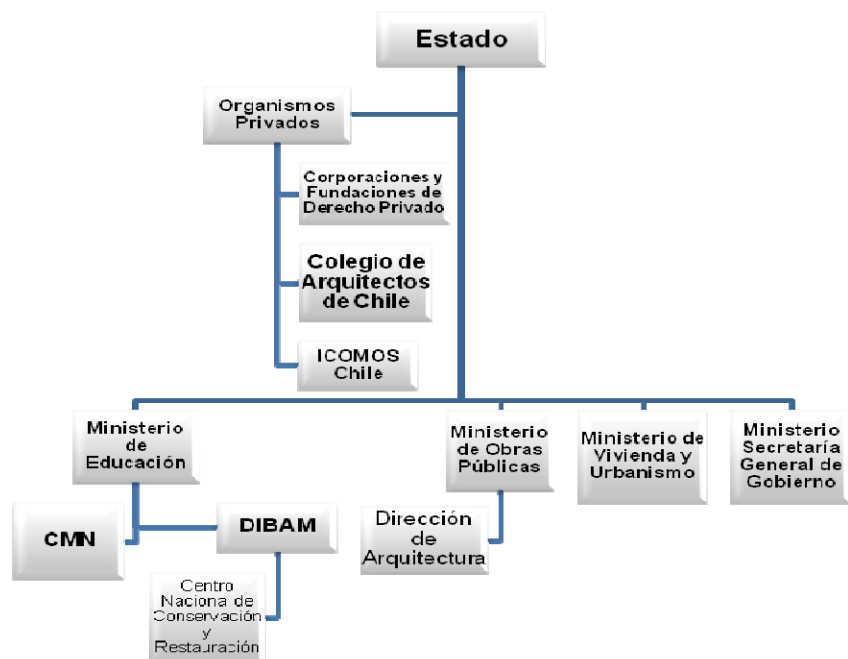
Cuadro 2. Organismos nacionales de preservación patrimonial.