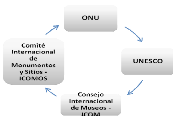
Cuadro 1. Organismos internacionales de preservación patrimonial.

Este comité tiene la finalidad de propender a la aplicación de las normas internacionales. Entre sus responsabilidades se encuentra la Convención del Patrimonio Mundial, donde asume la tarea de examinar los expedientes y de designar los expertos que informan los casos de postulación a la nominación de patrimonio de la Humanidad. Básicamente, su ámbito de acción concreto, particularmente en países latinoamericanos, es muy restringido a diferencia de otros ICOMOS, como los europeos, que tienen mucha fuerza y apoyo no gubernamental.