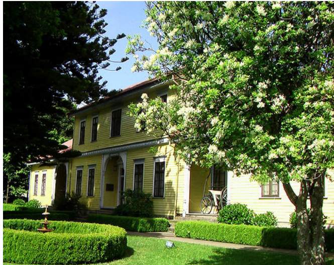
Museo Histórico y Antropológico Maurice Van de Maele, UACH.

Fundado el 17 de febrero de 1956, este museo es uno de los más famosos del país, gracias a sus valiosos testimonios de la Colonización Alemana, la documentación relacionada con las fortificaciones españolas y las muestras de la cultura aborígen.