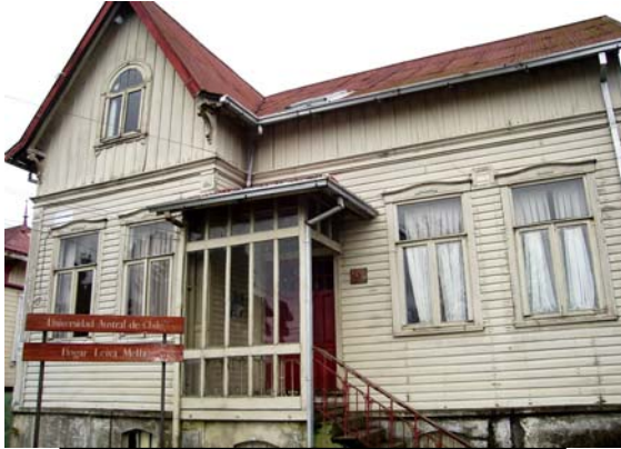
Hogar universitario masculino, UACH.

Fue adquirida en el año 1968 a Hellmuth Klempau para ser ocupada como hogar estudiantil. Fue remodelada y ampliada por la Universidad para acondicionarla operando actualmente como