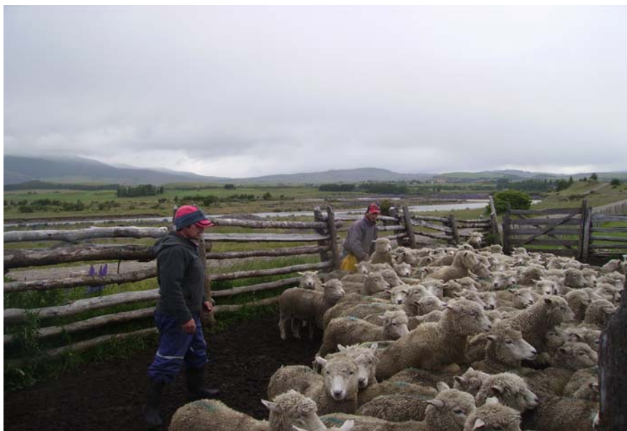
Figura 1. Trabajadores en labores de arreo de los animales, antes de la carga en los camiones de transporte.

En los 5 predios visitados, los que se fueron repitiendo durante el estudio, el proceso de arreo es realizado por los trabajadores del campo (figura 1). En general usan para arrear a los ovinos implementos como bastones, plumeros, botellas plásticas con piedras en su interior (“perros”), varillas, bolsas plásticas color negro, entre otros. En algunos casos este manejo es apoyado en forma eficiente por perros, que en su mayoría se encuentran adiestrados, para realizar este trabajo (figura 2).