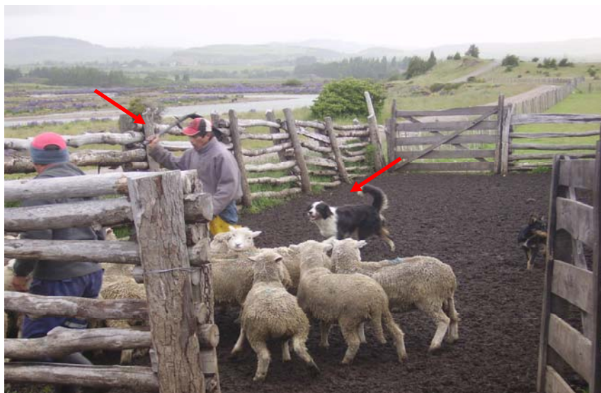
Figura 2. Utilización de elementos como plumeros y perros adiestrados como ayuda en el proceso de arreo de los animales.