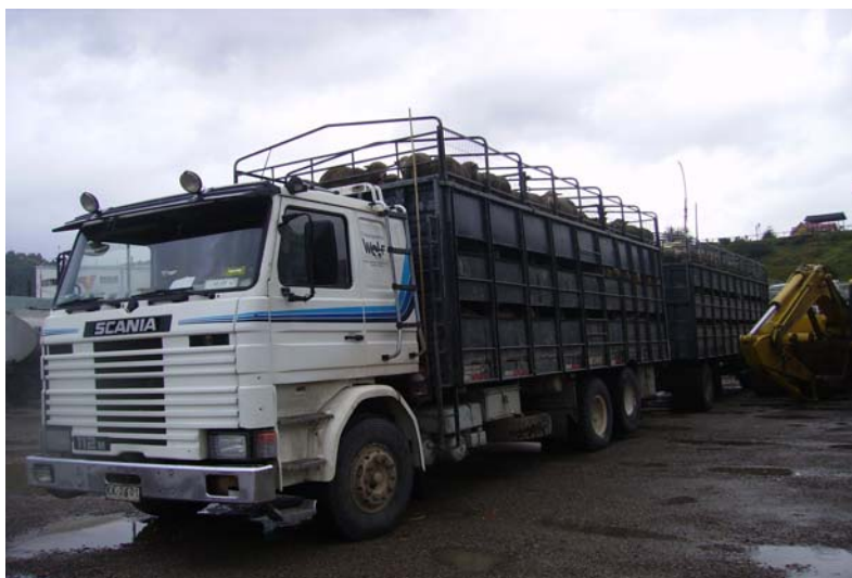
Figura 8. Camión con carro para el transporte ovino.

Para el caso de los ovinos que fueron transportados fuera de la región, se utilizaron 2 camiones con carro (figura 8) y 1 rampa, los que llegaron en forma repetida al embarcadero de Puerto Chacabuco trayendo 15 cargas, durante el periodo que se realizó el registro de datos. Para el caso de los vehículos que transportaron ovinos dentro de la región, se observaron en total 6 camiones y 1 carro, los que llegaron también en forma repetida a la Planta Mañihuales, con un total de 36 cargas.