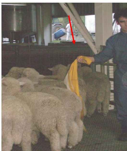
Figura 5. Empleado de la planta descargando animales hacia los corrales de espera con elemento de arreo.