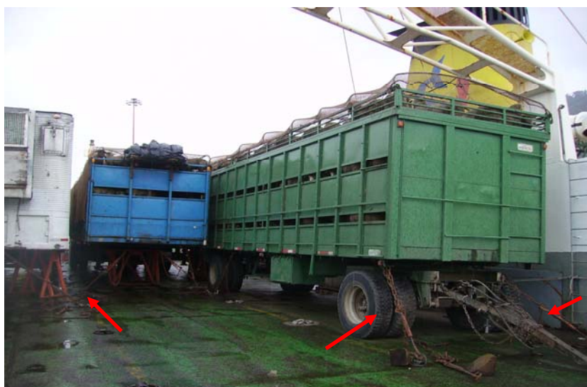
Figura 7. Fijación de los vehículos de transporte a la barcaza mediante cadenas o amarras de sujeción.

Las amarras de sujeción correspondían a cadenas (figura 7) y se encontraban fijadas en todos los camiones, carros o rampas de transporte animal, tanto atrás como adelante de estos vehículos, otorgándoles una buena tensión y estabilidad, por lo tanto menor movimiento frente a malas condiciones climáticas.