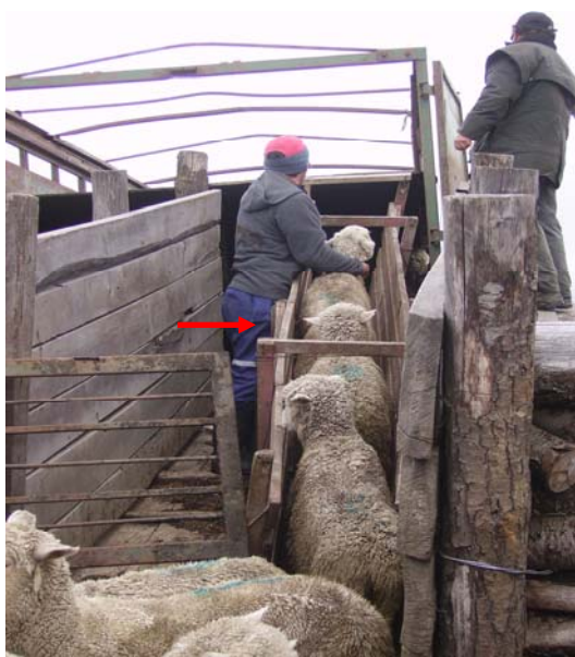
Figura 3. Carga de los ovinos en los camiones y/o carros de transporte.

La carga de los animales, se realizaba en forma ordenada y mediante la utilización de cargaderos (figura 3) contruidos en su totalidad de madera, de aproximadamente 50 cm de ancho con barandas laterales de 70 cm de alto, piso con listones de madera horizontales para evitar el deslizamiento de los animales al ir subiendo hacia el camión. Todos estaban contruidos específicamente para ganado ovino, con excepción de un solo predio en el que se utilizó, por problemas de tipo operacionales, un cargadero para ganado bovino. Para cargar los animales, los trabajadores utilizaban los mismos elementos de arreo mencionados anteriormente, tratando de evitar tirar del vellón.