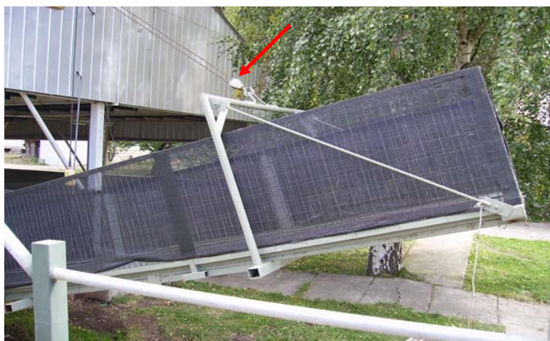
Figura 4. Rampa metálica con presencia de tecele, para acceder a los tres pisos del vehículo para descargar los animales.

En las 36 descargas observadas para el caso de los corderos que llegaban a la Planta Faenadora Mañihuales, se utilizaba una rampa metálica con una goma en el suelo que ayuda como antideslizante; la rampa tiene un tecele (figura 4), que permite adecuarla a la altura necesaria según el piso que se descarga. El personal de la planta, más el chofer y su ayudante, eran los encargados de bajar los animales de los vehículos hacia los corrales de espera. Para hacer salir del camión y descender a los animales, en algunos casos se utilizaban elementos de arreo (botellas, bolsas, etc.) que generaban ruido (figura 5). En otros casos se utilizaba un cordel para lacear al primer cordero del cuello, sacarlo y usarlo como animal guía para que el resto lo siguiera; en otros casos se tomaban del vellón, patas o del cuerpo y se tiraban o empujaban para hacerlos salir del carro o camión que lo transportaba (figura 6).