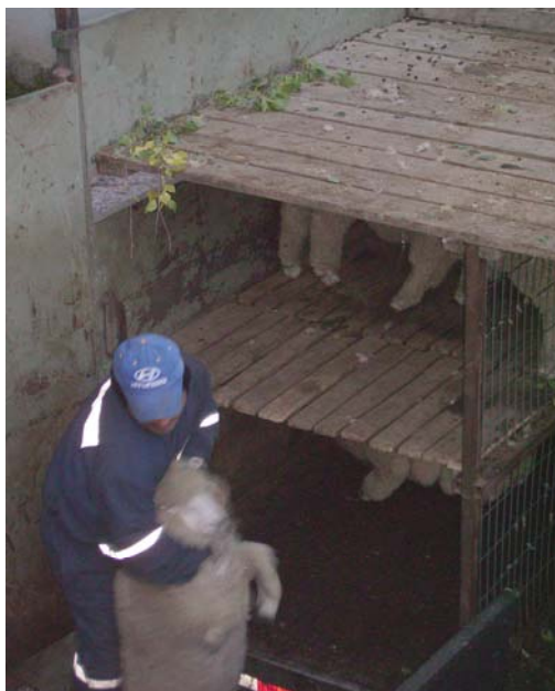
Figura 6. Ayudante de conductor tomando un animal para sacarlo del camión.

Una vez que los animales eran descargados, éstos eran agrupados en lotes en los corrales de espera, con agua para beber pero sin alimento, para que finalmente al otro día fueran faenados a primera hora de la mañana. El número de ovinos faenados por día era aproximadamente de 400; en su mayoría durante el año 2007 estaban dirigidos a mercados extranjeros y un número muy bajo a consumo regional.